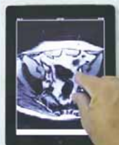
• 支持影像放大缩小