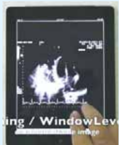
• 支持调整窗宽窗位