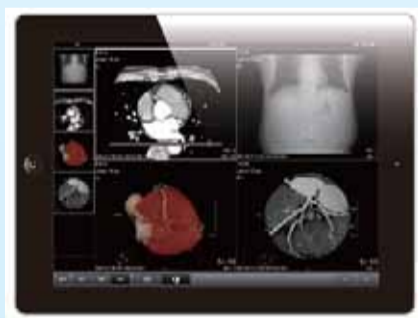
• 可与多种影像设备连接